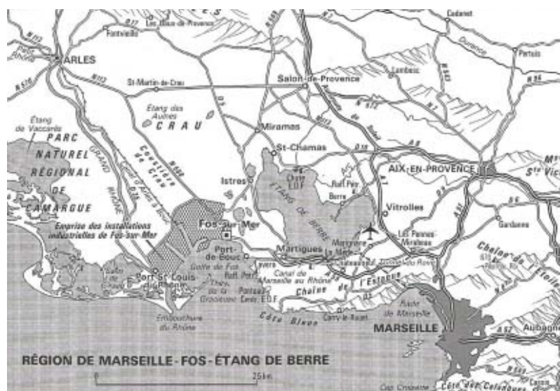
FIGURE 2.1 – Le site de Fos–étang de Berre au début des années 1970

opposition exacerbée par le projet d'incinérateur