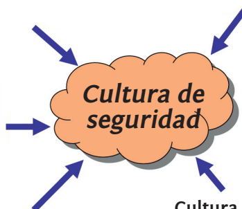
FIG. 4.1 — Componentes de la cultura de seguridad (según Reason, 1997).

Voluntad y competencias que permiten extraer del sistema de información conclusiones beneficiosas para la seguridad; voluntad de efectuar cambios importantes.